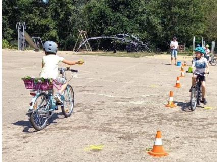
Ritterspiele auf dem Schulhof: Bei den Temperaturen am Dienstag und Mittwoch wurden alternative Übungsformen erfunden.

Parsevalstraße in der Vahr / Hemelingen, Grundschule Halmerweg in Gröpelingen, Jacobs Universität in Grohn) und unseren beiden Schulen in Bremerhaven (Surheider Schule und Pestalozzischule) hatten alle Kinder viel Spaß und Freude am Fahrradfahren und waren am Freitag traurig, dass diese