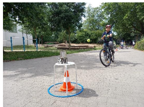
Dosenwerfen an der Parsevalstraße

Wir freuen uns, wenn wir auch in den Sommerferien 2023 wieder unsere Fahrradintensivkurse anbieten können. Jedes Kind, das Fahrradfahren kann und sein Fahrrad sicher beherrscht, ist ein Gewinn für uns alle. Und auch in diesem Jahr haben wir gesehen, dass manche Kinder kurzzeitig eine individuelle Betreuung brauchen, um das Ziel zu erreichen!