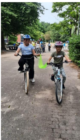
Sogar zu zweit – verbunden mit einem Tuch – schafften es die Teilnehmer:innen ohne Sturz vorwärts zu fahren