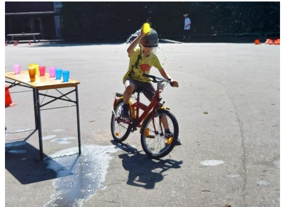
Abkühlung tut gut!