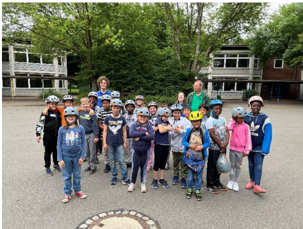
Gruppenfoto am Halmerweg