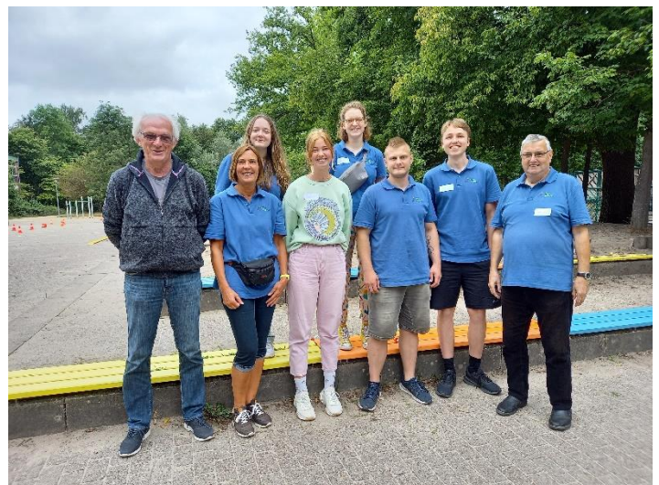
Unser Team an der Delfter Straße in Huchting