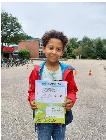
Fahrradführerscheinprüfung erfolgreich bestanden

Eine Woche lang haben helfende Hände Roller, Fahrräder, Helme und Material für den Fahrradparcours innerhalb Bremens bzw. nach Bremerhaven transportiert.