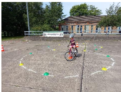
Am Montag noch etwas unsicher auf dem Fahrrad an der Jacobs Universität

Kindern genug Zeit zum Üben zu geben. Mit der Übung von fünf Tagen à fünf Stunden schaffen die praktische Prüfung auch die Kinder, in deren Familien das Fahrradfahren aufgrund ihrer Herkunft nicht selbstverständlich ist.